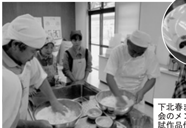
下北春まな推進協議会のメンバーによる試作品作り